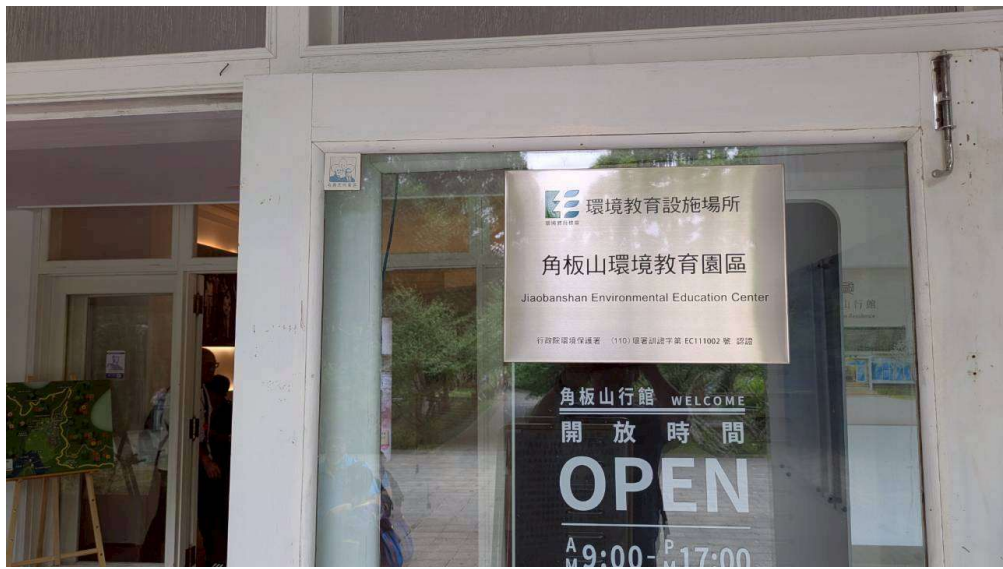
角板山環境教育園區-環境教育場域