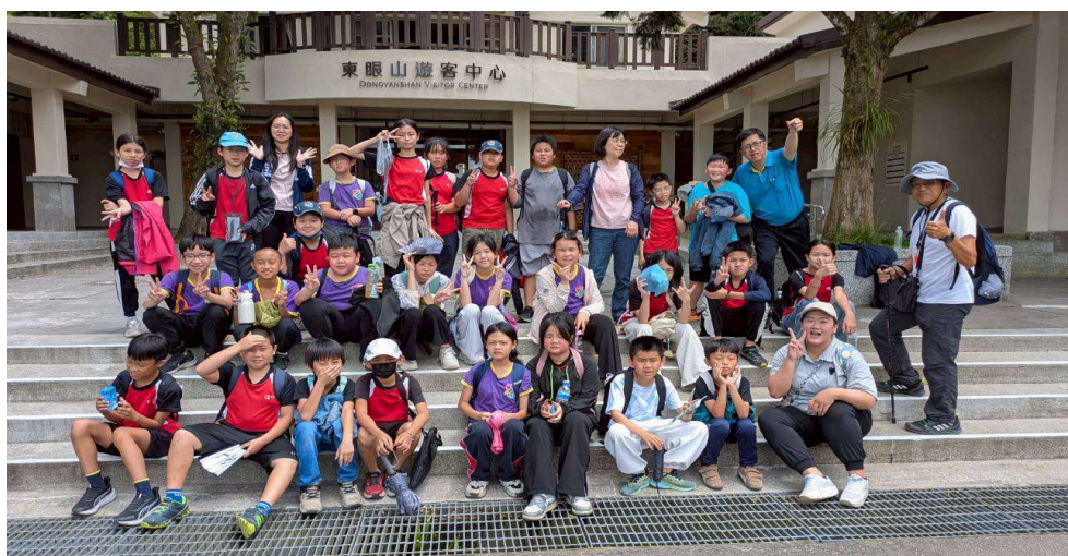
東眼山國家森林園區