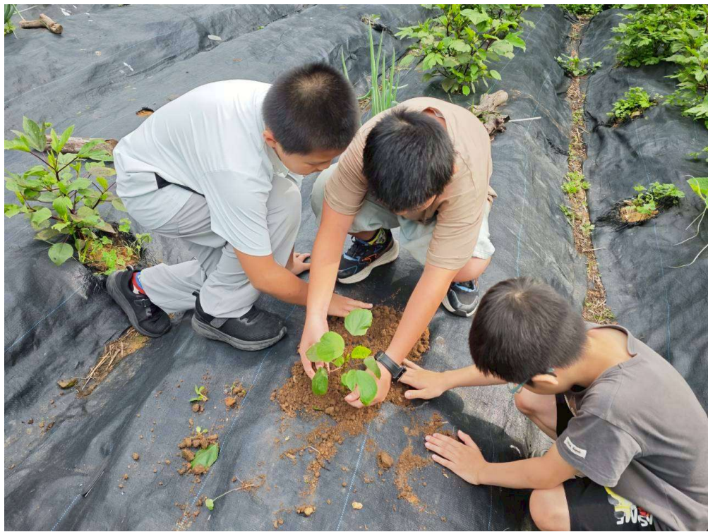
東眼山農場讓學生透過親手觸摸泥土種植、嗅聞香草植物