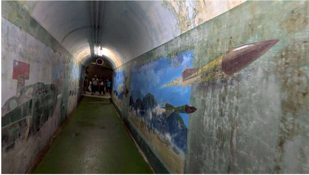
戰備隧道內 3D 立體壁畫