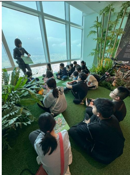
聆聽、學習專業導覽