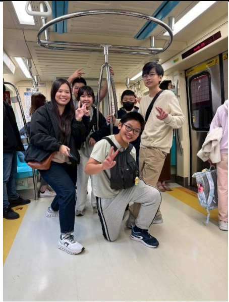
體驗不同的交通工具—捷運