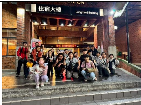
夜宿劍潭青年活動中心