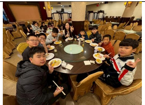
劍潭青年活動中心豐富早餐