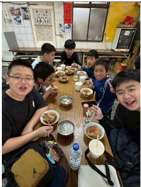
品嚐淡水美食—阿給、