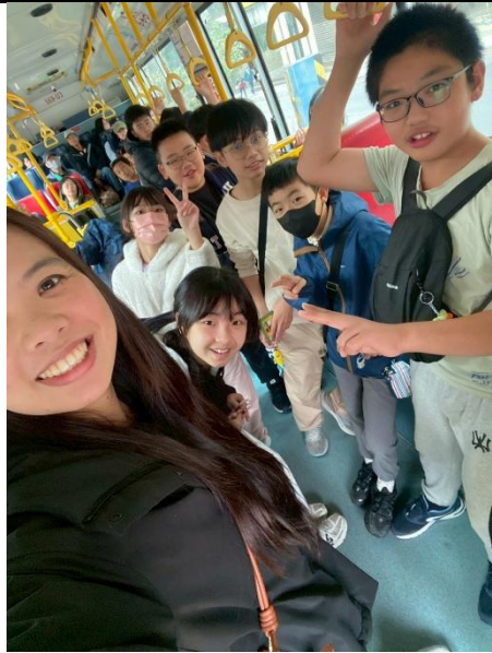
體驗不同的交通工具--公車