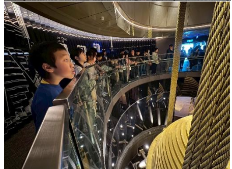
認識101綠建築、環保課程