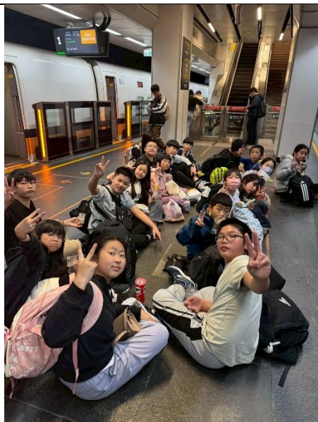
兩天的行程累了，直接坐在高 鐵台北站的地板上