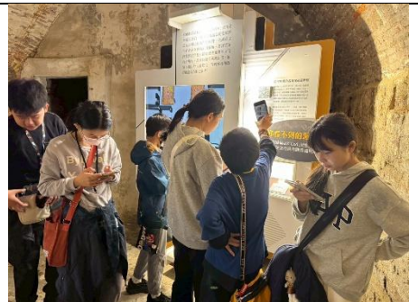
掃 QR-code 聽導覽