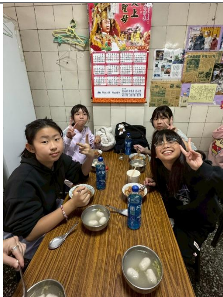
品嚐淡水美食—魚丸湯